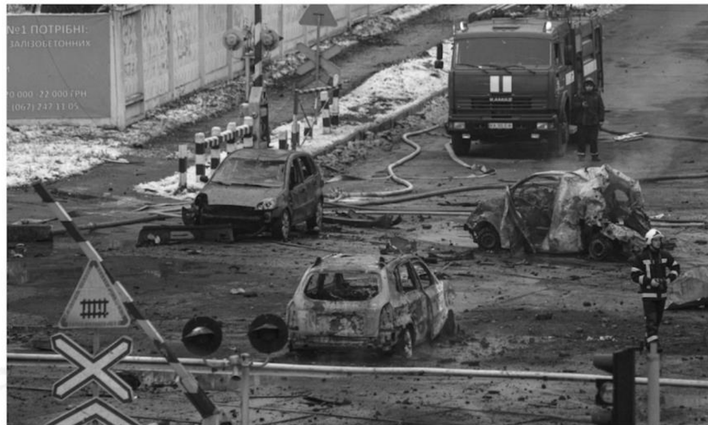
Hasič kráča okolo vrakov áut po ruskom raketovom útoku v Kyjeve v stredu 23. novembra 2022

Rusko vo štvrtok poprelo, že útokmi zámerné cielilo na ukrajinské hlavné mesto Kyjev. Zo spôsobenia škôd na kritickej energetickej infraštruktúre v ukrajinskej metropole obvinilo "zahraničné a ukrajinské" rakety protivzdušnej obrany.